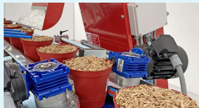
TP2400: détail des pots sortants recouverts de miscanthus.