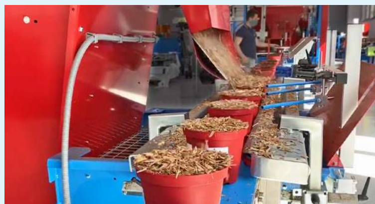
TP2800 en ligne avec la repoteuse IA3500 configurée avec une bande de sortie centrale; couverture des pots de miscanthus.