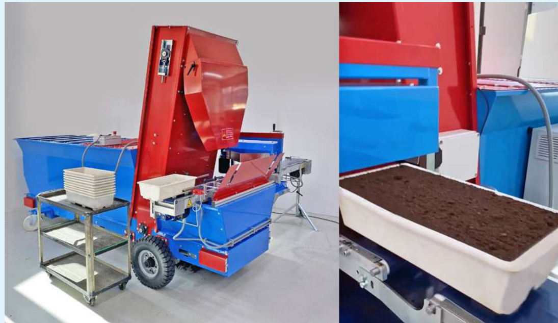
IM2800 equipada para llenado de bandejas planas.