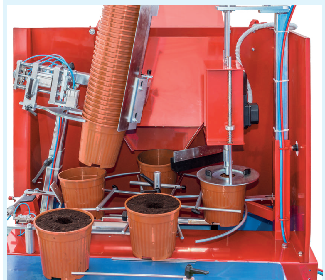
Versión de una cabeza : producción hasta 2400 macetas/hora .