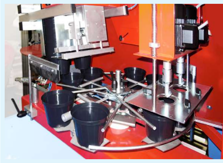
Versión de doble cabeza , para macetas de 8 a 14 cm : producción hasta 3500 macetas/hora .