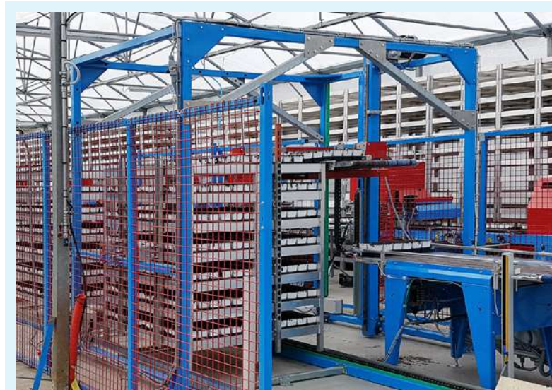
Cargador en la versión para chasis con sistema de avance con catenaria.