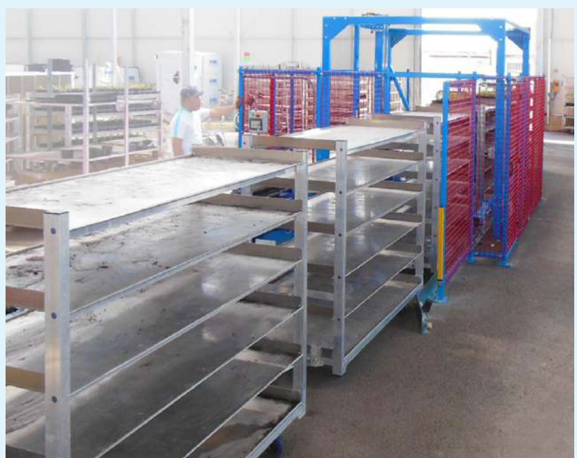
Entrada carros vacíos.