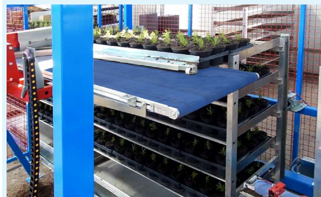
Fase de carga de macetas en los estantes del carro.