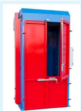
Versión 3 puertas: facilita la limpieza al cambiar fardos.