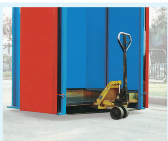
De desplazamiento simple mediante carretilla elevadora o transpaleta, con o sin fardos en su interior.