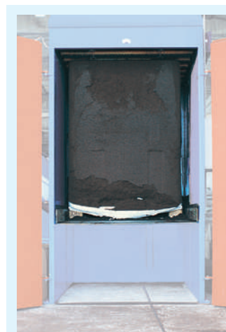
Mesa elevadora sin reducciones para paleta.