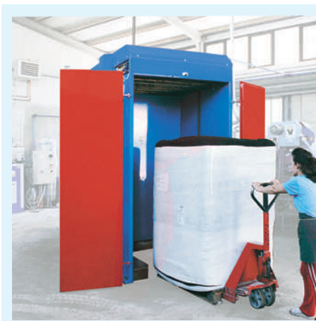
Fácil carga del fardo con cualquier medio. La parte no fresada puede descargarse intacta.