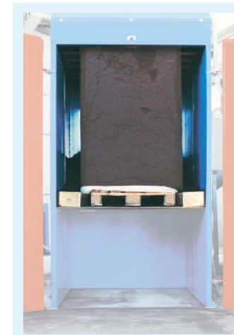
Reducciones para paleta.