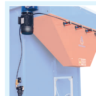
Equipo de humidificación .