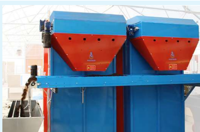
Las dos máquinas CARBB alimentando una única tolva.