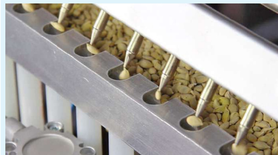
Les buses peuvent également semer de grosses graines , comme celles des agrumes .

La SEMKAPPA65 est une machine électromécanique, avec un mouvement automatique et synchronisé des plaques et un système d'alimentation à bande, pour une utilisation comme machine unique ou intégrée dans une ligne.