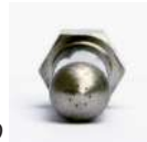
BOQUILLAS DE MULTI-AGUJERO