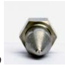
BOQUILLAS DE SINGOLO AGUJERO

Por sembradoras en hileras SEMSF13, SEMSF13-T y SEMKAPPA65