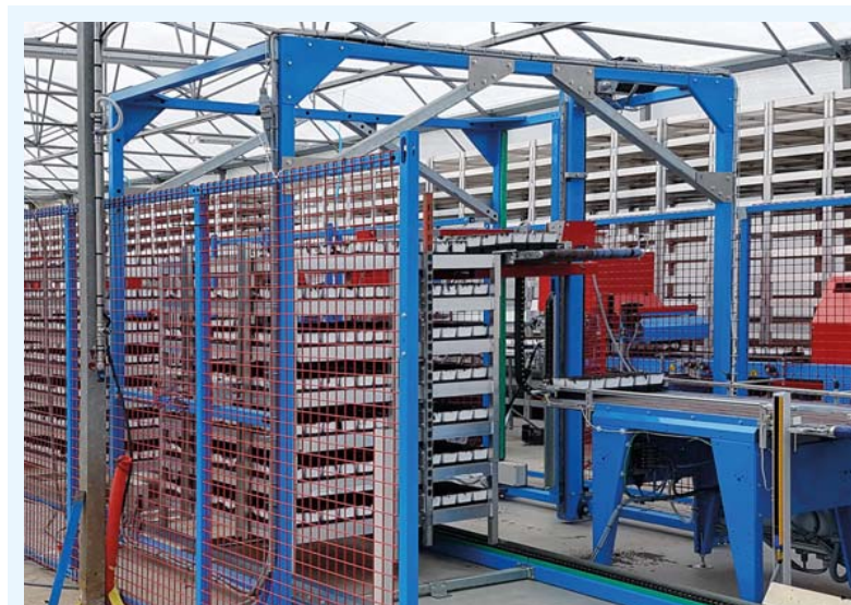
Caricatore nella versione per telai con sistema di avanzamento su catenaria.