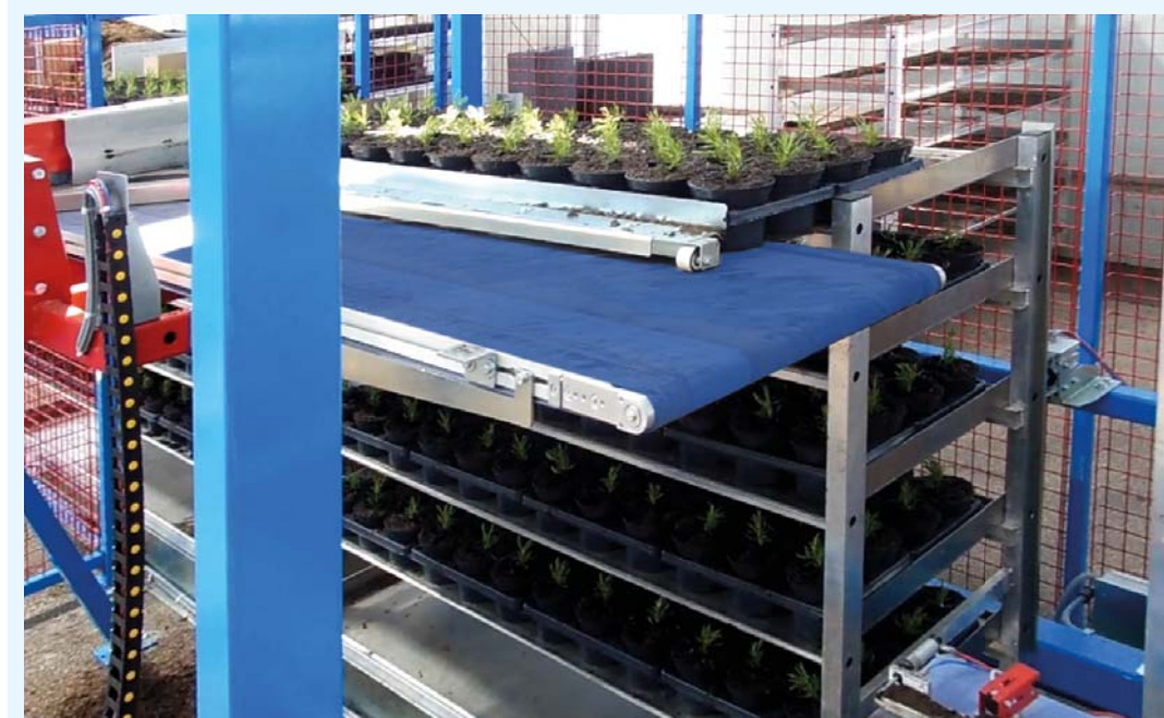
Fase di carico di vasi sui ripiani del carrello.