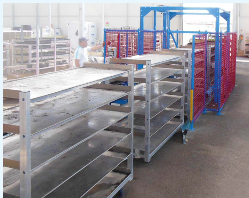
Ingresso carrelli vuoti.