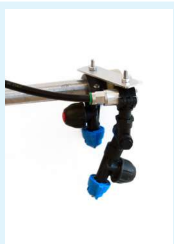
Ugello indipendente snodato completo di valvola per irrigazione bordi .