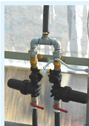
Doppio gruppo alimentazione: valvola a sfera, filtro a rete ed elettrovalvola.