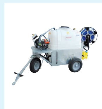
Pompa ad alta pressione con carrello per trattamenti fitosanitari con aspirazione del liquido residuo.