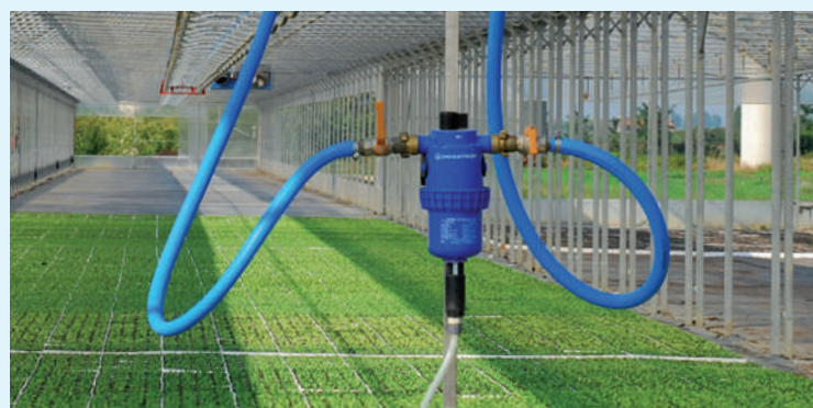
Dosatore proporzionale applicato direttamente sulla barra di irrigazione.