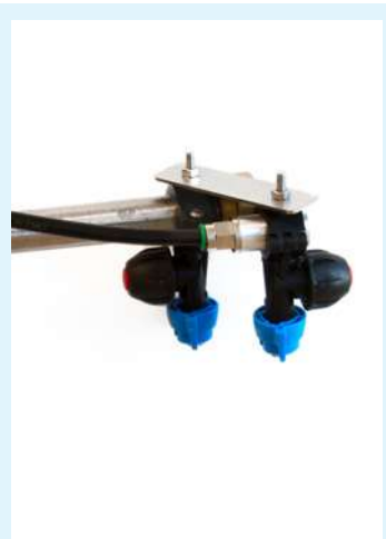
Ugello indipendente completo di valvola per irrigazione bordi .

Questi sono alcuni degli accessori disponibili per i nostri irrigatori . Il nostro ufficio tecnico è a vostra disposizione per consigliarvi quelli più adatti alle vostre esigenze.