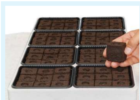
Cube de tourbe pressée en barquettes thermoformées.