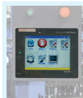
Panneau de commande avec écran tactile couleur de 8,4"