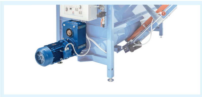
Moto riduttore pendolare collegato direttamente al rotore a spirale: nessun organo di trasmissione significa minor manutenzione.