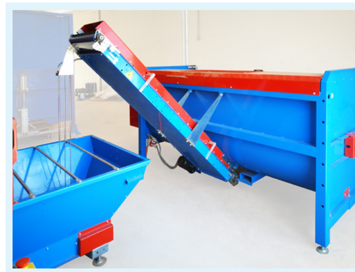
Nastro elevatore terriccio con sonde di livello .

Le componenti meccaniche dei miscelatori sono tutte di provenienza italiana certificata, il che si traduce in affidabilità nel tempo e un conseguente risparmio in manutenzione.