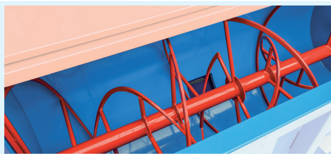
Rotore a doppia spirale in acciaio ad alta resistenza per ridurre l'usura.