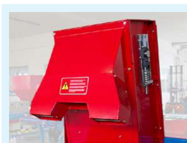
Bouche d'échappement double.

IM2800 équipé d'une goulotte et d'une plateforme au terreau avec moteur vibrant, qui convient particulièrement au remplissage de grands pots.