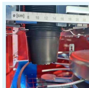
Dispositivo de separación de macetas doble (accesorio).