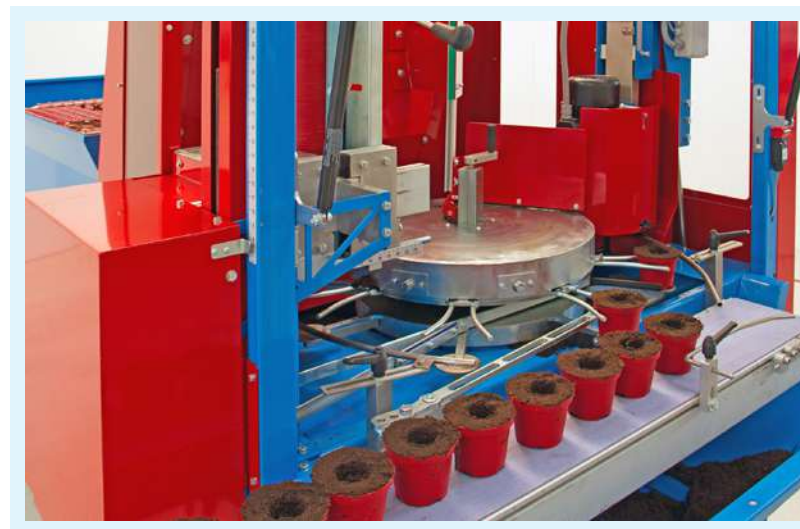
IA3500 con cabezal individual: macetas en salida del carrusel.