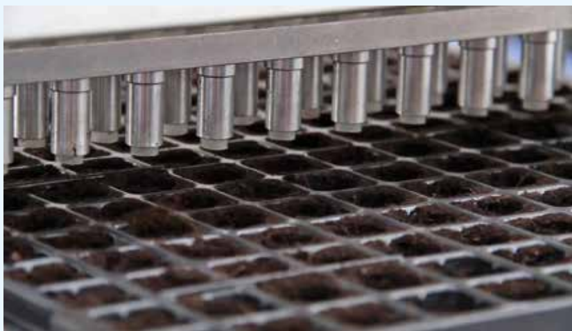
Línea de siembra KAPPA65C con boquillas de siembra de doble hilera.